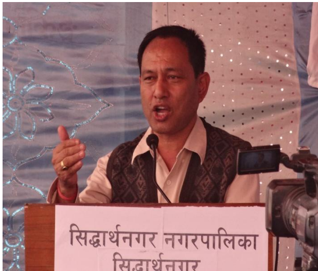
सहभागिवाट आफ्ना भनाई र सुझाव राख्दै